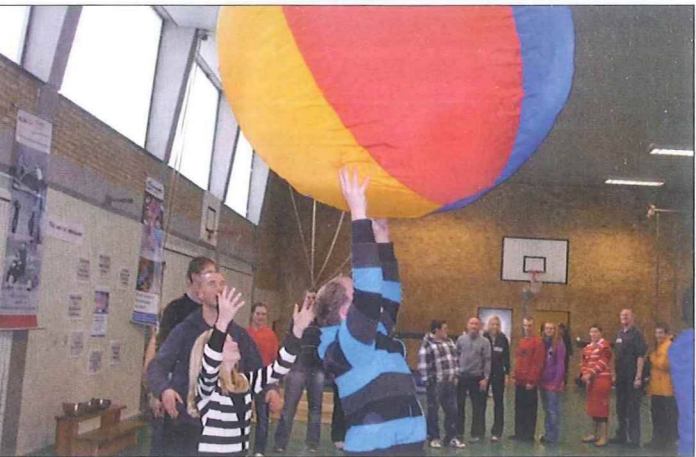
Der Rieseball für alle wird weitergegeben