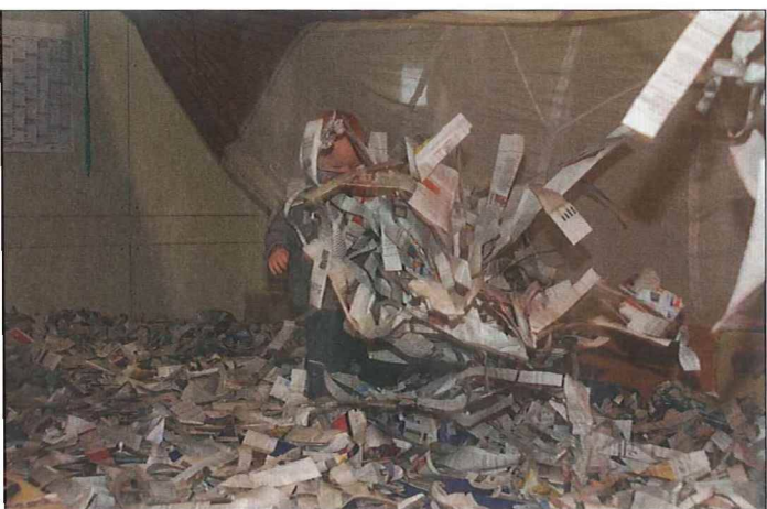
Bad in Zeitungspapier