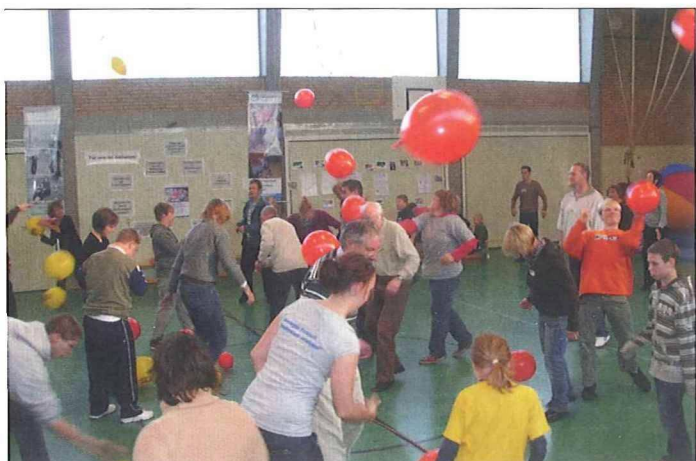
Der Luftballon sollte die Erde berühren